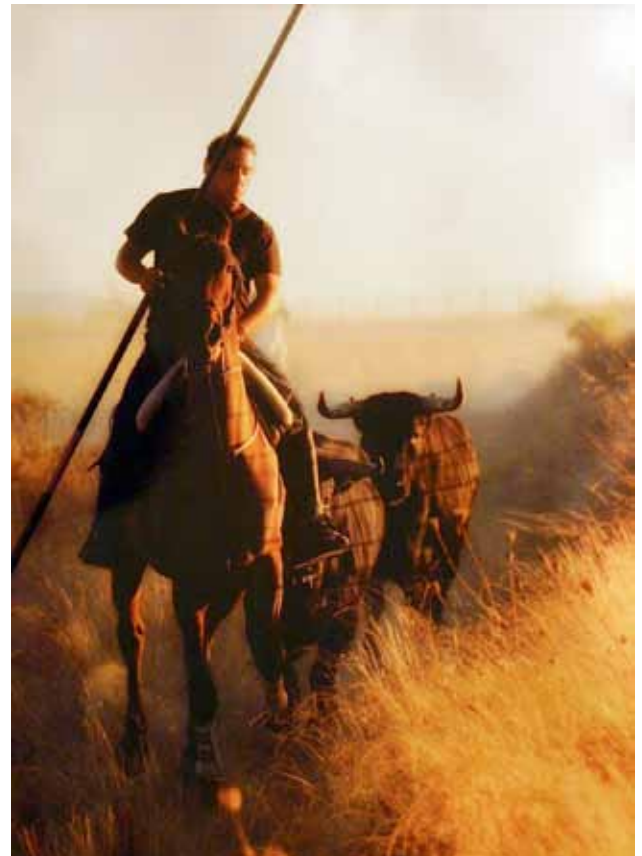
Primer Premio Sección Comunidad Valenciana 2009. Título: Desencierro. Autor: Jose J. Montón Montesinos

14ª ACEPTACION.- La participación en el concurso implica la aceptación de las presentes bases.