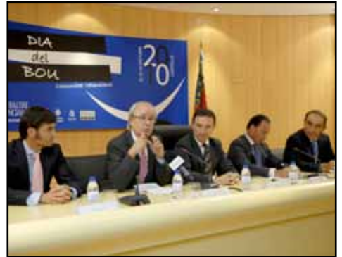
P. Mileo

Organizado por la Consellería de Interior de la Generalitat Valenciana, tuvo lugar en Castellón, bajo el título de "Día del Bou", unas jornadas reivindicativas destinadas a ensalzar y reivindicar la importancia del toro en nuestra comunidad, abarcando todos y cada uno de los aspectos que engloba, así como las distintas modalidades que acoge nuestra tierra.