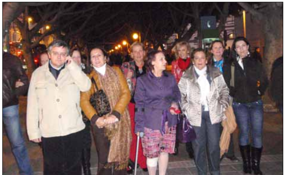
Una nutrida representación de La Revolera y La Puntilla se desplazó hasta Málaga para presenciar los festejos.

Tampoco disfrutaron los aficionados que se desplazaron hasta Madrid. Para esa tarde se anunciaba la "resurrección" de Talavante. La poca casta de los Cuvillos y las dificultades del viento, fueron mermando las ilusiones del extremeño, en una tarde venida a menos que terminó con almohadillas en el ruedo.