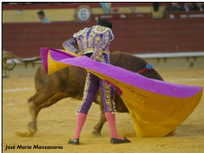
José María Manzanares