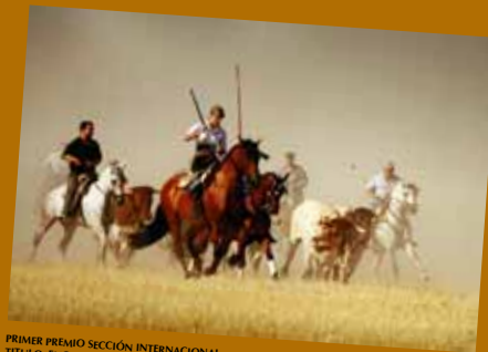
PRIMER PREMIO SECCIÓN INTERNACIONAL TITULO: ENCIERRO AUTOR: RICARDO GARCIA BUENO

XIX CONCURSO INTERNACIONAL DE FOTOGRAFIA TAURINA