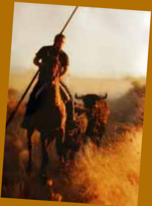
PRIMER PREMIO SECCIÓN COMUNIDAD VALENCIANA TITULO: SABOR AÑEJO AUTOR: JOSE J. MONTON MONTESINOS

XII CONCURSO NACIONAL DE CERAMICA TAURINA