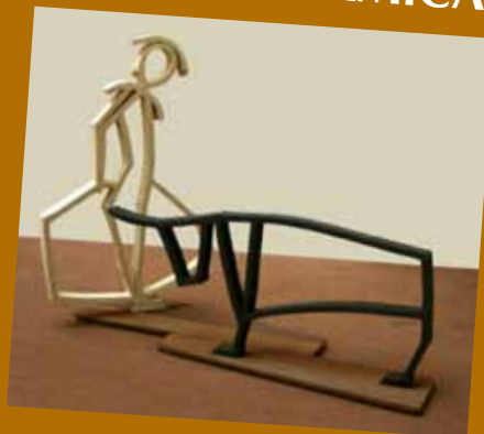
PRIMER PREMIO: FIESTA DEL TORO AUTORA: CARMEN TELLO FONT

XII CONCURSO NACIONAL DE CERAMICA TAURINA