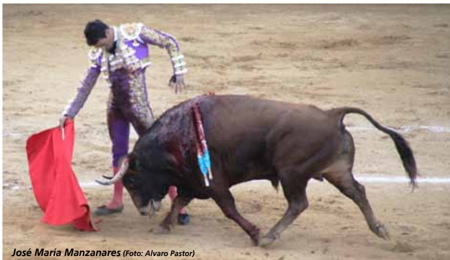
José María Manzanares