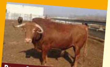
Desgreñado, N° 12, Guarismo 9