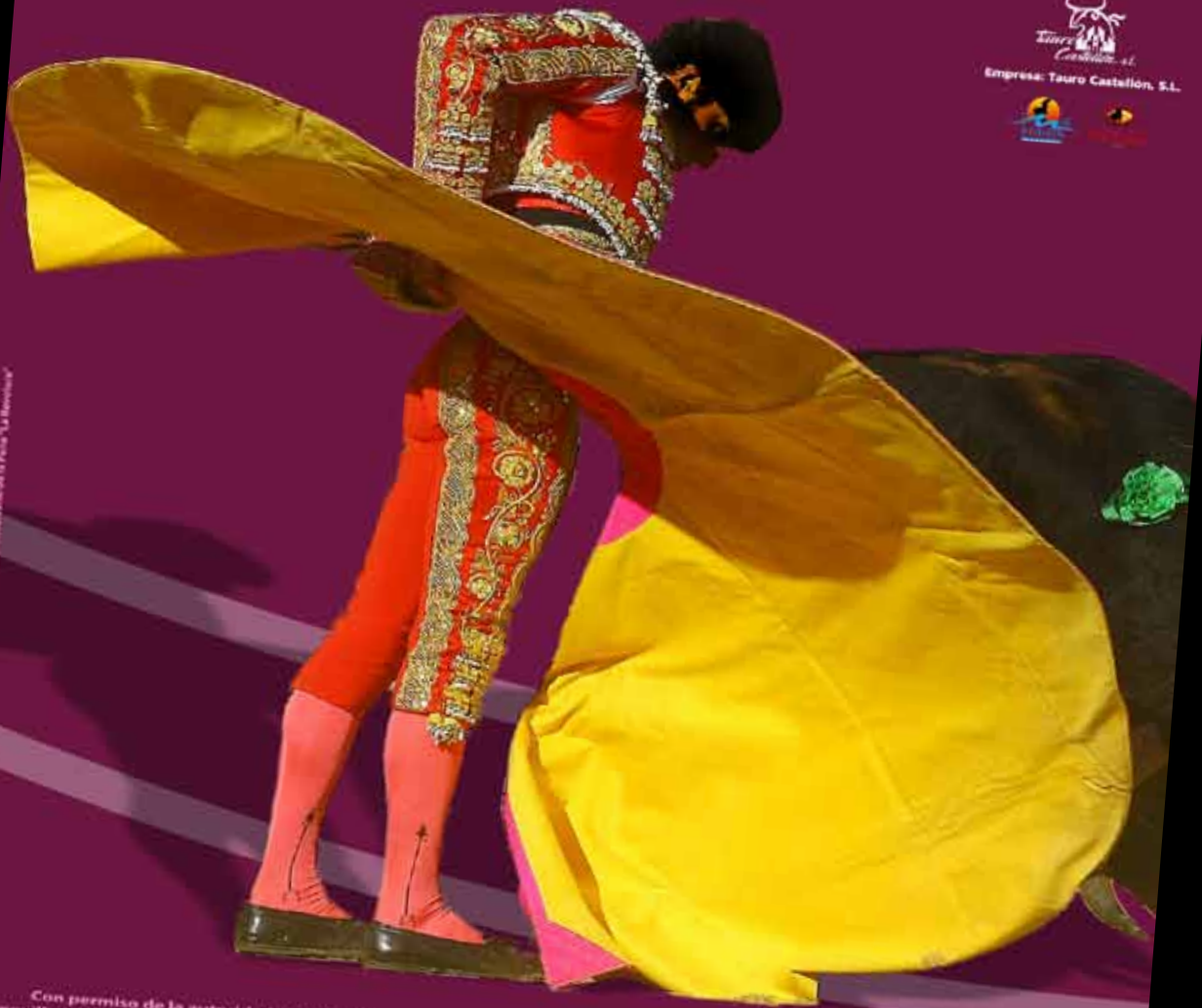
Cartel conmemorativo del XX aniversario de la Plaza "La Magdalena"

Con permiso de la autoridad y si el tiempo no lo impide, se celebrarán seis corridas de toros, una corrida de rejones y una novillada picada, de abono, y una novillada sin picar, fuera de abono, durante los días 11, 12, 13, 14, 15, 16, 17, 18 y 19 de marzo.